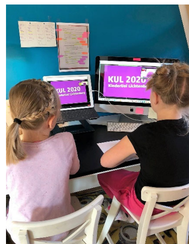
KUL 2020 zuhause